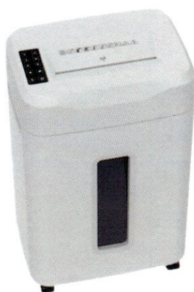
Fragmentadora Menno Destroyer 230 BR P