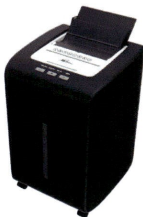
Fragmentadora 3Atech AF20035-P5